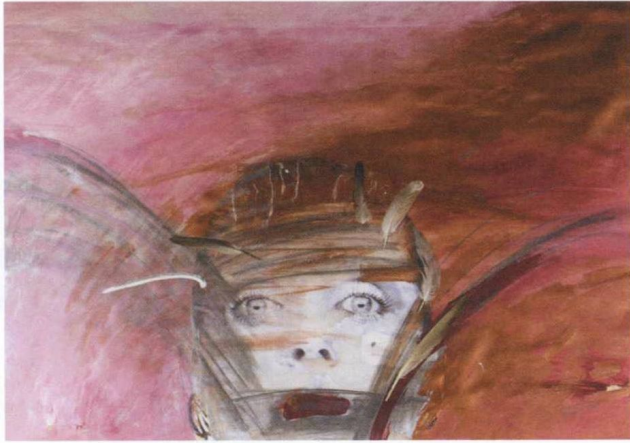
Tomur Atagök, Kuş Kadın, 2001